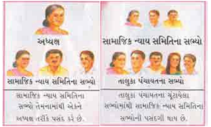
4.3 સામાજિક ન્યાયસમિતિ

તાલુકા અને જિલ્લા કક્ષાએ સામાજિક ન્યાય સમિતિ કાર્ય કરે છે. તાલુકા પંચાયતની જેમ જિલ્લા પંચાયતમાં ચૂંટાયેલા સભ્યોમાંથી આ સમિતિના સભ્યોની પસંદગી થાય છે. સામાજિક ન્યાયસમિતિના સભ્યો તેમનામાંથી એકને અધ્યક્ષ તરીકે ચૂંટે છે. જુદી-જુદી પંચાયતના સમાજના નબળા વર્ગોની જરૂરિયાતની રજૂઆત સામાજિક ન્યાયસમિતિમાં કરવામાં આવે છે. અહીં વિવાદોનો ઉકેલ લાવવાનો પ્રયત્ન કરવામાં આવે છે.