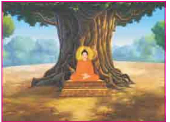
7.1 ગૌતમ બુદ્ધ

આ સમય એવો હતો કે જ્યારે એ સમયના લોકોના જીવનમાં ઝડપથી પરિવર્તન આવી રહ્યું હતું.