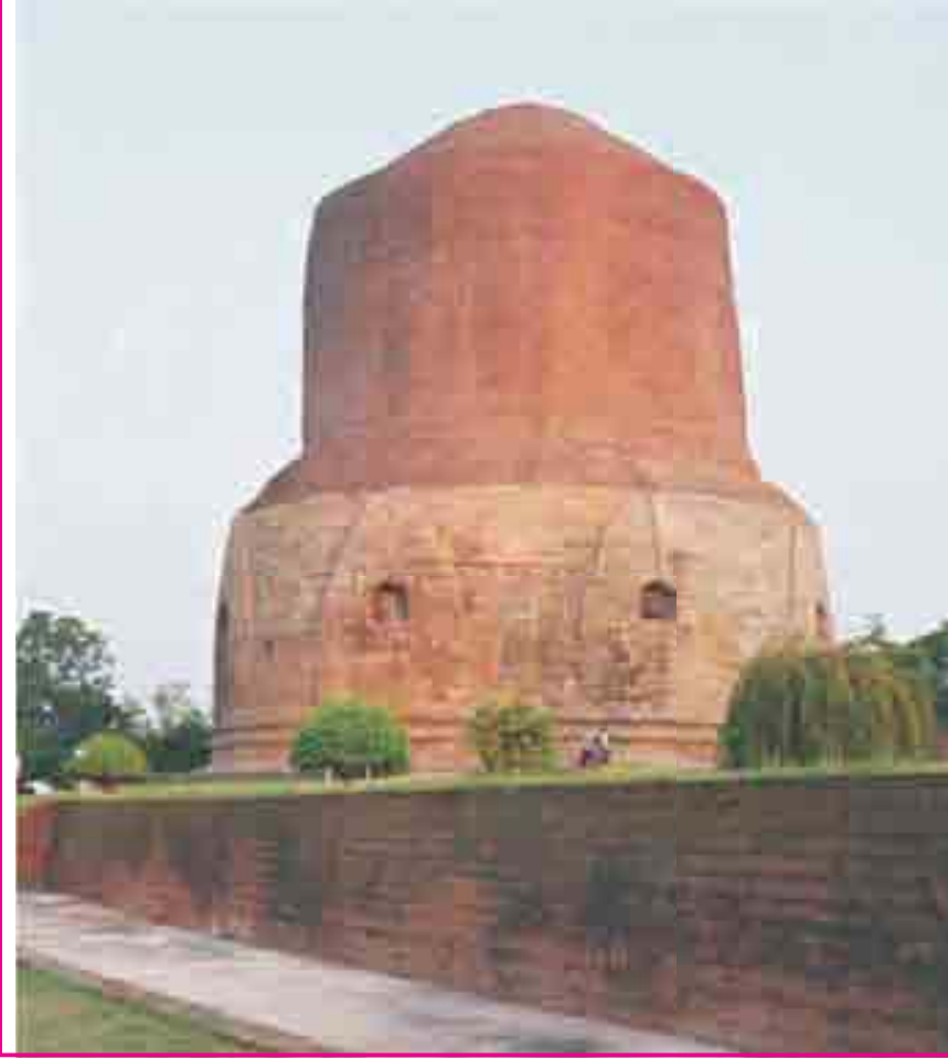
7.2 સારનાથ સ્તૂપ

સમાજમાં ઊંચનીચના ભેદભાવો હતા. ધર્મની બાબતમાં લોકો સ્વતંત્ર રીતે વિચાર કરવા લાગ્યા હતા. ગણરાજ્યોના કેટલાક રાજાઓ વધુ શક્તિશાળી થઈ ગયા હતા. ગામડાંઓમાં પણ પરિવર્તન આવી રહ્યું હતું. નગરો બનવા લાગ્યાં હતાં. ઘણા જિજ્ઞાસુ જીવનનો સાચો અર્થ જાણવા માગતા હતા.