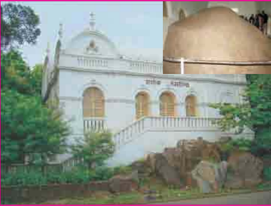
9.1 અશોકનો શિલાલેખ

જૂનાગઢના પ્રવાસે જનાર લોકો ઐતિહાસિક સ્થળોની મુલાકાત જરૂર લે છે. ગિરનાર પર્વત, ઉપરકોટ કિલ્લો, મ્યુઝિયમ, દામોદરકુંડ, ભવનાથ મહાદેવ વગેરે. દરેક સ્થળ સાથે કોઈ વાત કે માન્યતાઓ જોડાયેલી હોય છે. તેમાં તળેટી સ્થિત અશોકના શિલાલેખની મુલાકાત લેનાર વત્સલને પ્રશ્ન થયો કે આ શિલાલેખ એટલે શું? એ કોણે લખાવ્યા હશે? ક્યાં કારણોસર એ લખવામાં આવ્યાં? તે જાણવામાં તેને રસ પડ્યો.