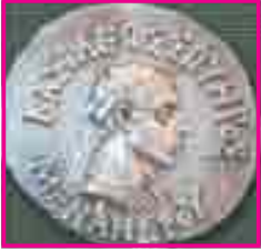
9.7 શક સિક્કો

ઉત્તર તથા મધ્ય ભારતના કેટલાક પ્રદેશોમાં પુષ્પમિત્ર શુંગ તથા તેના પછી કણ્વ તેમજ અન્ય વંશોનું શાસન પણ ચાલતુ રહ્યું.