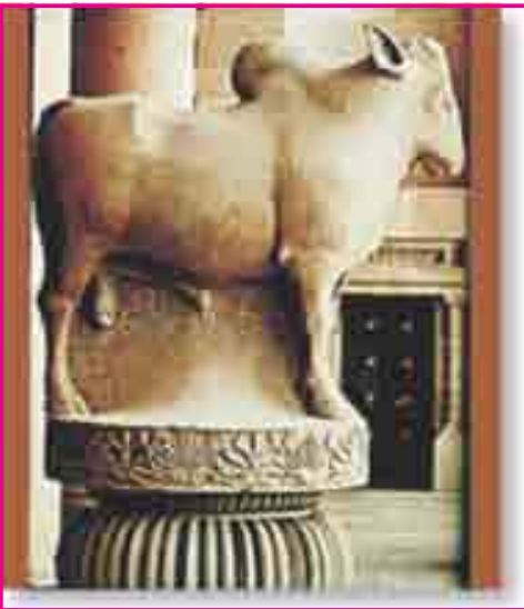
9.4 મૌર્યકાલીન સ્તંભનો એક ભાગ

સમ્રાટ અશોકે ‘ધમ્મ’નો પ્રચાર શા માટે કર્યો ?