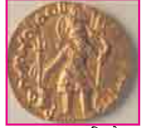
9.6 કુષાણ સિક્કો

મૌર્યસામ્રાજ્યના પતન પછી તેના સ્થાને કેટલાક નવાં રાજ્યોનો ઉદય થયો. તેમાં ઉત્તર-પશ્ચિમ ભારતમાં યવન (ગ્રીક) રાજાઓનું, પશ્ચિમ ભારતમાં શક નામના મધ્ય એશિયાઈ લોકોનું શાસન સ્થપાયું. શકો પછી કુષાણોનું શાસન સ્થપાયું.