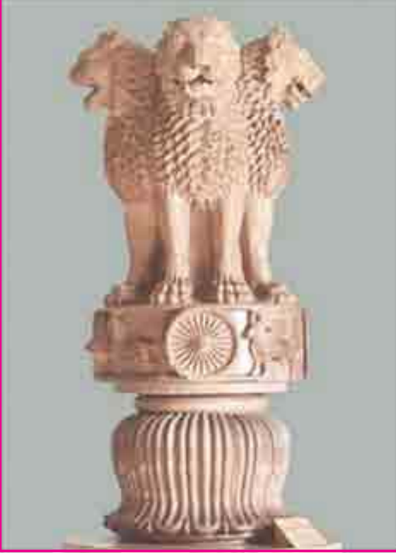
9.2 સિંહસ્તંભ (ભારતની રાજમુદ્રા)

સારનાથના સિંહસ્તંભથી આપણે સૌ પરિચિત છીએ. (જુઓ ચિત્ર), જે આજે આપણી રાજમુદ્રા છે. દરેક ચલણી નોટ, સિક્કા, સરકારી કાગળો કે પર તે છપાયેલી હોય છે.