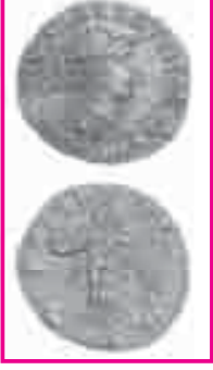
9.5 યવન સિક્કો

મૌર્યસામ્રાજ્યના પતન પછી તેના સ્થાને કેટલાક નવાં રાજ્યોનો ઉદય થયો. તેમાં ઉત્તર-પશ્ચિમ ભારતમાં યવન (ગ્રીક) રાજાઓનું, પશ્ચિમ ભારતમાં શક નામના મધ્ય એશિયાઈ લોકોનું શાસન સ્થપાયું. શકો પછી કુષાણોનું શાસન સ્થપાયું.