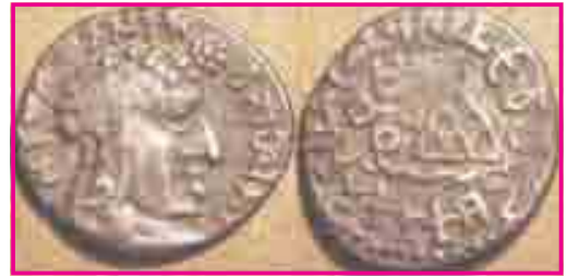
9.8 સાતવાહન સિક્કો

આ ઉપરાંત અન્ય રાજ્યો અને રાજાઓ પણ હતાં. તેના વિશે આપણને તે સમયના સિક્કા, પાન્ડુલિપિ તથા પુસ્તકો પરથી ખ્યાલ આવે છે. શહેરોનો, ખેતીનો, ઉદ્યોગોનો તથા વેપારનો વિકાસ પણ આ સમયમાં શરૂ થયો. કેટલાક ભૂમિમાર્ગો, સમુદ્રમાર્ગો પણ શોધાયા. મંદિરો, સ્તૂપો તથા અન્ય ઇમારતો બંધાઈ.