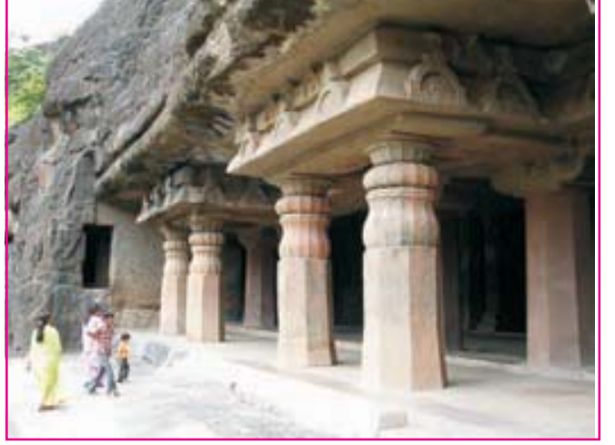
1.8 અજંતાની ગુફા

પુલકેશી બીજો વીર હતો, તેમ કળાનો પણ શોખીન હતો. તેના સમયમાં વાતાપી અને ધારાપુરીની ગુફાઓ નિર્માણ પામી હતી. અજંતાની ગુફાનાં કેટલાંક જગમશહૂર ભીંતચિત્રો એ વખતે બન્યાં. હ્યુ-એન-ત્સાંગ હિન્દમાં ફરતો ફરતો દક્ષિણ ભારતમાં પુલકેશીના દરબારમાં ગયેલો. તેના વૈભવના હ્યુ-એન-ત્સાંગ ખૂબ જ વખાણ કરે છે. આ રાજાઓ હિન્દુ ધર્મના ઉપાસકો હતા. આ સમયે બૌદ્ધ ધર્મ ધીમો પડ્યો હતો. જૈન ધર્મની એક શાખા 'દિગંબર'નો પ્રભાવ વધ્યો હતો.