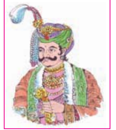
1.1 સમ્રાટ હર્ષવર્ધન

પિતા પ્રભાકરવર્ધનનું અવસાન થતાં મોટા ભાઈ રાજ્યવર્ધન થાણેશ્વરની રાજગાદી સંભાળતા હતા. તેમનું ગૌડ રાજવી શશાંકના દગાના કારણે મૃત્યુ થયું. બહેન રાજ્યશ્રીને માળવાના રાજા દેવગુપ્તે કેદ કરી હતી. આવા કપરા સંજોગોમાં રાજ્યના આગેવાનોની સલાહથી હર્ષવર્ધને થાણેશ્વર (વર્તમાન પંજાબ – હરિયાણા) મુકામે રાજગાદી સંભાળી. રાજસત્તા મળતાંની સાથે જ તેણે કેદ થયેલી બહેન રાજ્યશ્રીને મુક્ત કરાવવાનું નક્કી કર્યું. વનવાસી સ્ત્રીઓ અને બૌદ્ધ સાધુ દિવાકર મિત્રની મદદથી હર્ષવર્ધનને રાજ્યશ્રીને વિંધ્યનાં જંગલોમાં ‘સતી થતી’ અટકાવવામાં સફળતા મળી. આ સમયે કનોજ (ઉત્તરપ્રદેશ)નું રાજ્ય રાજા વગરનું હોવાથી હર્ષે પોતાની બહેનનું રાજ્ય સ્વહસ્તક લીધું. ત્યાર બાદ તેણે માળવાના રાજા દેવગુપ્તને હરાવ્યો. ગૌડ રાજવી શશાંક પર આક્રમણની તૈયારીના ભાગરૂપે તેણે કામરૂપ (આસામ)ના રાજા ભાસ્કરવર્મન સાથે કુનેહપૂર્વક મૈત્રીસંબંધો બાંધ્યા. આગળ જતાં વિશાળ સૈન્ય સાથે ગૌડ રાજવી શશાંકને તેણે સખત હાર આપી, તેના રાજ્યનો મોટો ભાગ જીતી લીધો. માળવા અને સૌરાષ્ટ્ર પર પણ વિજય મેળવ્યો. જોકે દક્ષિણના ચાલુક્ય રાજવી પુલકેશી બીજા સાથેના યુદ્ધમાં તેને સફળતા મળી નહિ. છતાં સતત સાત વર્ષ સુધી વિજયયાત્રા કરીને સમ્રાટ હર્ષવર્ધને થાણેશ્વરના એક નાનકડા રાજ્યમાંથી ઉત્તર ભારતમાં એક વિશાળ સામ્રાજ્ય ઊભું કર્યું.