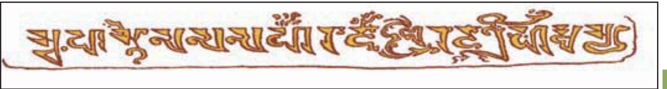
1.2 હર્ષના હસ્તાક્ષર

રાજ્યના સમગ્ર વ્યવસ્થાતંત્ર પર હર્ષવર્ધન જાતે દેખરેખ રાખતો હતો. નિરીક્ષણ કરવા માટે તે રાજ્યના વિવિધ ભાગોમાં સતત પ્રવાસ કરતો હતો. પોતાની દિનચર્યાને તેણે ત્રણ ભાગમાં વહેંચી હતી. પ્રથમ ભાગ વહીવટ માટે, બાકીના બે ભાગ પ્રજા કલ્યાણ તથા ધાર્મિક કાર્યો માટે ફાળવતો. વહીવટમાં તે ન્યાયી અને ફરજપાલનમાં ખૂબ જ નિયમિત હતો. સદ્કાર્યો કરવામાં તે ભોજનને પણ ભૂલી જતો.