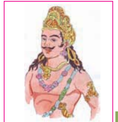
1.7 પુલકેશી બીજો

ચાલુક્ય વંશમાં પુલકેશી બીજાએ આશરે 30 વર્ષ રાજ્ય કર્યું. આ રાજા ઘણો પ્રતાપી અને બહાદુર યોદ્ધો હતો. તેણે અનેક લડાઈઓ જીતી. તેણે પ્રથમ લાટ (દ. ગુજરાત) અને પછી ગુર્જર (ઉ. ગુજરાત) જીતેલાં. કૃષ્ણા અને ગોદાવરી વચ્ચેના વેંગી પ્રદેશો પર વિજય પ્રાપ્ત કર્યો. આંધ્રપ્રદેશ પણ તેના કબજામાં હતું. રાજધાની વાતાપીને તેણે ખૂબ સુંદર નગરી બનાવી હતી.