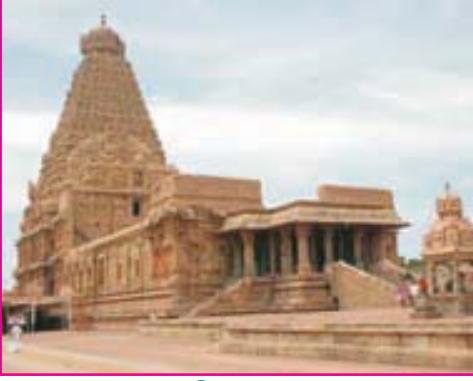
6.3 તાંજોરનું મંદિર

રાજપૂત યુગમાં જે બાંધકામો થયાં; તેમાં મંદિરોનાં બાંધકામ નોંધપાત્ર છે. રાજપૂત રાજાઓ ભવ્ય અને કલાત્મક ઈમારતો બંધાવવાના ખૂબ શોખીન હતા. તેમણે બંધાવેલાં મંદિરો, કિલ્લાઓ, રાજમહેલો, જળાશયો વગેરે પરથી તે સમયના સ્થાપત્ય અને શિલ્પનો ખ્યાલ આવે છે.