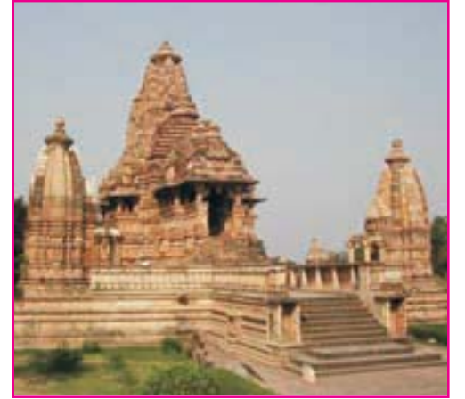
6.4 ખજૂરાહોનું મંદિર

દક્ષિણ ભારતમાં ઈલોરામાં હિંદુ, બૌદ્ધ અને જૈન એમ ત્રણ ધર્મની ગુફાઓ છે, તેમાં કૈલાસ મંદિર ભવ્ય છે. મુંબઈ નજીક એલિફન્ટાની ગુફાઓ આવેલી છે; તેમાં ત્રણ મુખવાળા શિવનું શિલ્પ પ્રસિદ્ધ છે.