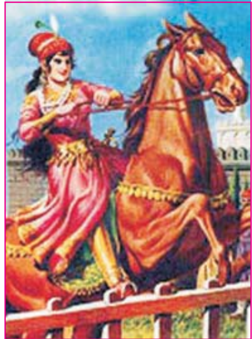
8.2 રઝિયા બેગમ

કુત્બુદ્દીન ઐબક પછી ગાદીએ આવનાર ઇલ્તુત્મિશ પણ શરૂઆતમાં ગુલામ હતો. તેણે ભારતના ઘણા પ્રદેશો જીતીને દિલ્લી સલ્તનત સાથે જોડ્યા હોવાથી, તેને ગુલામ વંશનો ખરો સ્થાપક માનવામાં આવે છે. તેના અવસાન પછી દિલ્લીની ગાદી ઉપર તેની પુત્રી રઝિયા (ઈ.સ. 1236માં) આવી. રઝિયા દિલ્લીની ગાદી ઉપર આવનાર પ્રથમ મહિલા શાસક (સુલતાના) હતી. રઝિયા શાસક તરીકે કાબેલ હતી. પુરુષનો પોશાક પહેરીને તે રાજ-દરબારમાં બેસતી. એ સમયના ઇતિહાસકાર મિન્હાસ-એ-સિરાજ આ નોંધે છે કે, “રઝિયા તેના ભાઈઓ કરતાં શાસન માટે વધારે સક્ષમ અને કાબેલ હતી. તેમ છતાં તે એક સ્ત્રી હોવાથી, શાસકના રૂપમાં તેને સ્વીકારવામાં આવતી ન હતી.”