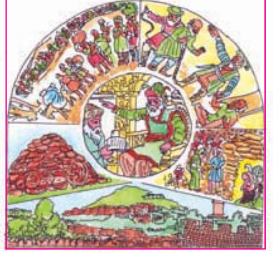
8.5 મહંમદની તરંગી યોજનાઓ

અલાઉદ્દીન ખલજીના અવસાન પછી ચાર જ વર્ષમાં તુઘલુક વંશનું શાસન આવ્યું. ગ્યાસુદ્દીન તુઘલુકે તેની સ્થાપના કરી. તેના સમયમાં 'ડાક્યોકી' ટપાલપદ્ધતિ દાખલ થઈ હતી. ઘોડેસવારો કાગળ લઈ જતા. ટપાલીને એ સમયમાં 'હલકારો' કહેતા. (હલકારા વિશેની માહિતી 'સૌરાષ્ટ્રની રસધાર'માંથી મેળવો.) ગિયાસુદ્દીન પછી મહંમદ તુઘલુક નામનો સુલતાન ગાદીએ આવ્યો. ત્યારે તેણે કેટલીક યોજનાઓ અમલમાં મૂકી; જેની જોરદાર ટીકાઓ થઈ. આ યોજનાઓમાં દિલ્લી અને દોલતાબાદ વચ્ચે રાજધાનીનું સ્થળાંતર, તાંબાના સિક્કાઓનું ચલણમાં સ્થાન વગેરે મુખ્ય છે. મહંમદ તુઘલુકના સમયમાં તાંજિરના હબસી મુસાફર ઈબ્નબતૂતા ભારતની મુલાકાતે આવ્યા હતા. તેમણે સુલતાનના વહીવટની સમાલોચના કરતાં લખ્યું છે, 'મહંમદ શાહના રાજ્યમાં પ્રકાશ અને અંધકાર બંને એક સાથે જોવા મળે છે.'