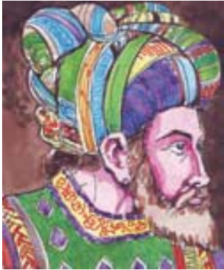
8.3 અલાઉદ્દીન ખલજી

રઝિયાએ પોતાના અભિલેખો અને સિક્કાઓ પર લખાવ્યું હતું કે તે ઈલ્તુત્મિશની બેટી છે. આધુનિક આંધ્ર પ્રદેશના વારંગલ ક્ષેત્રમાં એક કાકતીયવંશનું શાસન હતું. આ વંશની રાણી રુદ્રમ્માદેવી (1262-1289)નો વ્યવહાર રઝિયાથી બિલકુલ વિપરીત હતો. રુદ્રમ્માદેવીએ અભિલેખોમાં પોતાનું નામ પુરુષો જેવું લખાવ્યું હતું. આવું જ કશ્મીરની એક સમયની રાણી દિદા માટે પણ છે. તેને કાશ્મીરની પ્રજા ‘દીદી’ ના સ્નેહભર્યા સંબોધનથી બોલાવતી હતી.