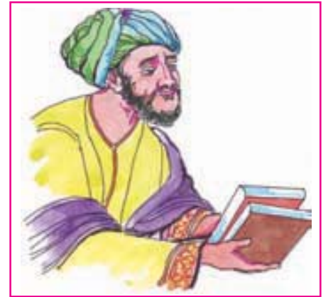
8.4 અમીર ખુશરુ

બલ્બનના અવસાન પછી માત્ર ચાર વર્ષમાં દિલ્લીની ગાદી ઉપર ખલજી વંશના શાસનનો દોર શરૂ થયો. અફઘાનિસ્તાનના ખલજી નામના સ્થળે રહેતી તુર્ક જાતિને ખીલજી કે ખલજી કહેવામાં આવતી. જલાલુદ્દીન ખલજીએ ગુલામ વંશને ઉખેડીને ખલજી વંશની સ્થાપના કરી હતી. ઈ.સ. 1296માં તેના ભત્રીજા અને જમાઈ અલાઉદ્દીન ખલજીએ દિલ્લીની સત્તા જલાલુદ્દીન પાસેથી આંચકી લીધી. તે પોતે સુલતાન