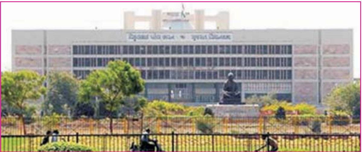
9.1 ગુજરાત વિધાનસભા

ભારતના દરેક રાજ્યમાં 'વિધાનસભા' હોય છે. રાજ્યના વિસ્તારોને જુદા જુદા મતવિભાગમાં વહેંચવામાં આવે છે. દરેક મતવિભાગમાંથી એક એક સભ્ય ચૂંટાય છે. ગુજરાતમાં વિધાનસભાની કુલ બેઠકો 182 છે. દરેક રાજ્યની વિધાનસભાના સભ્યોની સંખ્યા જુદી જુદી હોય છે. તેની સભ્યસંખ્યા વસ્તીને ધોરણે નક્કી થાય છે. તમને ખબર હશે કે દર પાંચ વર્ષે જ્યારે ચૂંટણી થાય ત્યારે લોકો અલગ અલગ પક્ષમાંથી ઉમેદવારી કરે છે. અપક્ષ તરીકે પણ ઉમેદવારી કરી શકાય છે. મોટેભાગે વિધાનસભ્યો અલગ અલગ રાજકીય પક્ષોના હોય છે તેમજ કોઈપણ પક્ષના નહિ એવા અપક્ષો પણ હોય. ગુજરાતનું વિધાનસભા ભવન પાટનગર ગાંધીનગરમાં આવેલું છે. તેનું નામ છે વિક્ટલભાઈ પટેલ વિધાનસભા ગૃહ.