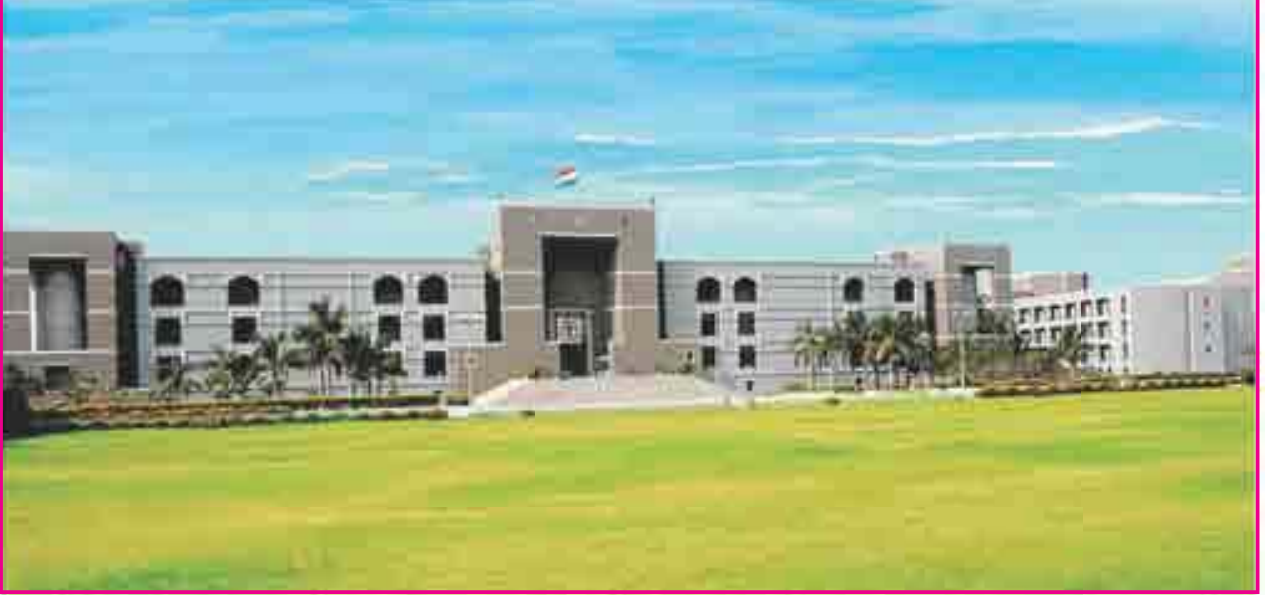
3.3 ગુજરાતની વડી અદાલત