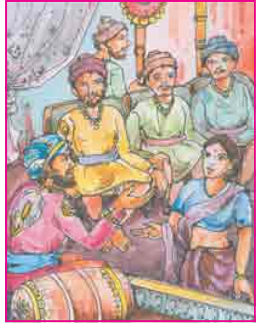
3.1 સાચો ન્યાય

બીજો દિવસ થયો. દરબાર ભરાયો હતો. ધોબણ આવી. તેણે બાદશાહ પાસે ન્યાય માંગ્યો. બાદશાહ કહે : ‘હા... હું ન્યાય કરીશ.’ બધા દરબારી શાંતચિત્તે સાંભળતા હતા.