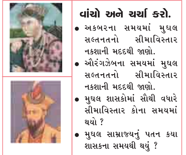
6.7 મુઘલસત્તાનો વિકાસક્રમ

ઈ.સ. 1526માં શરૂ થયેલ મુઘલ સામ્રાજ્ય ઈ.સ. 1707માં પતન તરફ ઢળવા લાગ્યું. બાબર દ્વારા શરૂ થયેલ મુઘલ સામ્રાજ્ય ઔરંગઝેબના સમયમાં ભારતમાં ફેલાયેલ હતું અને તેના જ સમય કાળમાં પતનની શરૂઆત થઈ બાજુમાં આપેલ ચિત્રના આધારે મુઘલ શાસન વિશે ચર્ચા કરો.