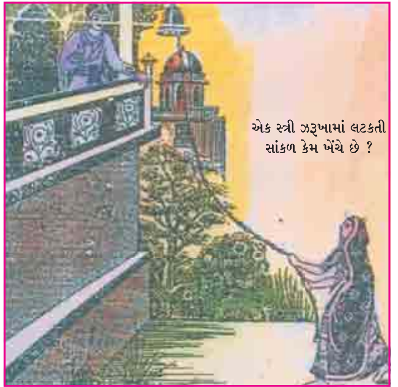
6.1 જહાંગીરની ન્યાયપ્રિયતા

મુઘલ શાસકો જહાંગીર, શાહજહાં અને ઔરંગઝેબના શાસનકાળની કેટલીક મહત્વની ઘટનાઓ વિશે જાણીએ.