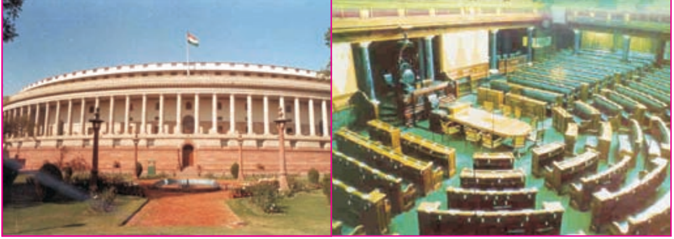
8.1 સંસદ ભવન