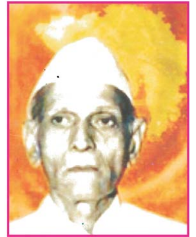
13.1 ઈન્દુલાલ યાજ્ઞિક : ગુજરાતની અસ્મિતાના સ્વપ્નદેષ્ટા

ઉગ્ર ચળવળના પરિણામે સંસદે 1960ના મુંબઈના દ્વિભાષી રાજ્યનું વિભાજન કરીને મહારાષ્ટ્ર અને ગુજરાત રાજ્યની અલગ રચના કરી. નવા ગુજરાત રાજ્યનું ઉદ્ઘાટન પૂજ્ય રવિશંકર મહારાજના હસ્તે થયું. 1 મે, 1960ના