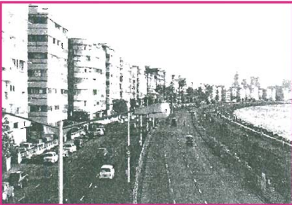
13.3 મરીનડ્રાઈવ, મુંબઈ અમીરવર્ગનો વસવાટ

ઘણાબધા વિદેશી વિવેચકો માનતા હતા કે ભારત એક રાષ્ટ્ર તરીકે વધુ સમય નહિ ટકે. કેટલાક લોકો માનતા હતા કે ભારત લશ્કરી શાસન હેઠળ આવી જશે. પરંતુ આ આશંકાઓ નિર્મૂળ સાબિત થઈ છે. ભારત આજદિન સુધી પ્રજાસત્તાક રાહ પર છે, જે ગૌરવ કરવા લાયક સફળતા છે. અહીંના લોકોની ભાષા અને ધર્મની વિવિધતા રાષ્ટ્રની એકતામાં બાધક બની નથી. ઔદ્યોગિક, વૈજ્ઞાનિક, આંતરમાળખાકીય સુવિધાઓ, કૃષિ અને શૈક્ષણિક વિકાસમાં રાષ્ટ્રે પ્રગતિ સાધી છે.