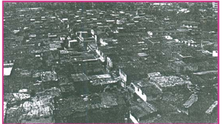
13.4 મુંબઈમાં આવેલી ધારાવી દુનિયાની સૌથી મોટી ઝૂંપડપટ્ટીમાંની એક છે.