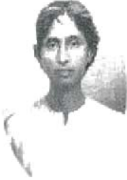
5.4 ખુદીરામ બોઝ