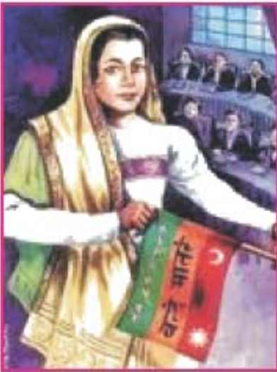
5.10 મેડમ કામા

મહાન દેશભક્ત શ્યામજી કૃષ્ણવર્મા અને તેમનાં પત્ની ભાનુમતીનાં અસ્થિ 4 સપ્ટેમ્બર, 2003ના રોજ ભારતમાં લાવી તેમના વતન માંડવી (કચ્છ)માં ભારે સન્માનપૂર્વક સ્થાપિત કરાયાં. તેમના અસ્થિની ગુજરાતમાં વિરાંજલિ યાત્રા કાઢવામાં આવી હતી.