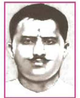
5.5 રામપ્રસાદ બિસ્મિલ

બિસ્મિલે લખેલ સાહિત્ય જ્યારે પ્રકાશમાં આવ્યું ત્યારે તેમની કવિતાઓએ રાષ્ટ્રીય ચેતનાનું પ્રેરકબળ પૂરું પાડ્યું.