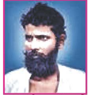
5.2 વાસુદેવ બળવંત ફડકે

ભારતમાં ક્રાન્તિકારી પ્રવૃત્તિની સૌપ્રથમ શરૂઆત કરનાર વાસુદેવ બળવંત ફડકે હતા. તેઓ પૂણેમાં નોકરી કરતા હતા. અંગ્રેજ સરકારના અન્યાયી ત્રાસથી કંટાળીને વાસુદેવ ફડકેએ નોકરી છોડી દીધી. દેશને ગુલામીમાંથી મુક્ત ન કરું, ત્યાં સુધી કપાળ પર ચંદન ન લગાડવાની તથા કેશકર્તન ન કરવાની પ્રતિજ્ઞા લીધી. વાસુદેવ ફડકેએ અંગ્રેજ સરકાર સામે દેશવ્યાપી સશસ્ત્ર સંગઠનની ગુપ્ત યોજના બનાવી હતી.