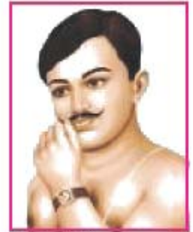
5.7 ચંદ્રશેખર આઝાદ

અસહકારની ચળવળમાં ચંદ્રશેખરે ભાગ લીધો હતો. તેમની ધરપકડ થઈ. અંગ્રેજ પોલીસના હાથે પકડાયા, ત્યારે તેમની ઉંમર એટલી નાની હતી કે હાથકડી મોટી પડી હતી ! અદાલતમાં તેમને પૂછવામાં આવ્યું તમારું નામ શું ? તો તેમણે કહ્યું, 'આઝાદ', પિતાનું નામ 'સ્વાધીનતા' અને પોતાના ઘરને 'જેલખાનું' બતાવ્યું હતું. ત્યાર બાદ તેઓ 'આઝાદ' તરીકે ઓળખાયા.