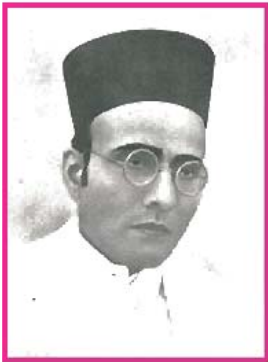
5.3 વીર સાવરકર

વિનાયક દામોદર સાવરકરનો જન્મ 28 મે, 1883ના રોજ મહારાષ્ટ્રના નાસિક જિલ્લાના ભગૂર નામના ગામમાં થયો હતો. નાનપણથી જ તેઓ ક્રાન્તિકારી વિચારો ધરાવતા હતા. તેમણે 'મિત્રમેલા' નામની સંસ્થા સ્થાપી હતી, જે પાછળથી 'અભિનવ ભારત' નામથી જાણીતી બની. આ સંસ્થાનો હેતુ સશસ્ત્ર વિપ્લવ દ્વારા ભારતમાંથી અંગ્રેજ શાસનનો અંત લાવવાનો હતો.