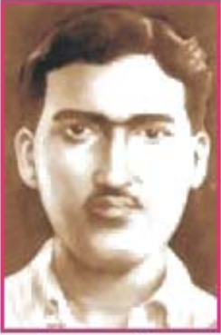
5.6 અશફાક ઉલ્લાખાં