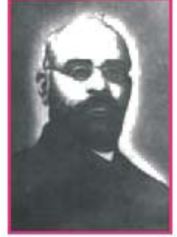
59 શ્યામજી કૃષ્ણવર્મા

વિદેશોમાં ક્રાન્તિકારી પ્રવૃત્તિની શરૂઆત કરનાર શ્યામજી કૃષ્ણવર્માનો જન્મ ઈ.સ. 1857ની ચોથી ઓક્ટોબરે કચ્છના માંડવી ગામે થયો હતો. તેઓ કેમ્બ્રિજ યુનિવર્સિટીમાં સ્નાતક થયા હતા. તેમણે ભારતમાં સ્વરાજ મેળવવાના ઉદ્દેશથી લંડનમાં 1905ની 18મી ફેબ્રુઆરીએ 'ઇન્ડિયન હોમરૂલ સોસાયટી'ની સ્થાપના કરી. સંસ્થાનું કાર્યાલય 'ઇન્ડિયા-હાઉસ' નામે મકાનમાં રાખવામાં આવ્યું હતું. આ સંસ્થાના પ્રચાર માટે તેમણે 'ઇન્ડિયન સોશિયોલોજિસ્ટ' નામનું સામયિક શરૂ કર્યું.